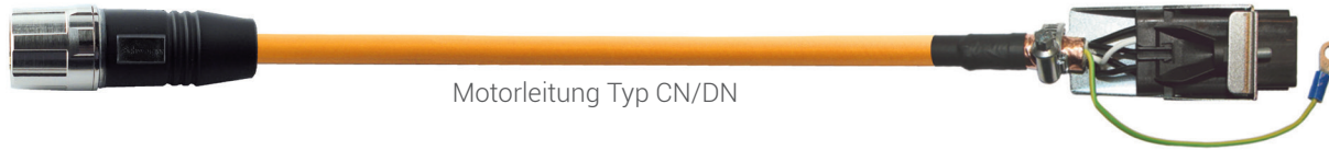
Motorleitung Typ CN/DN